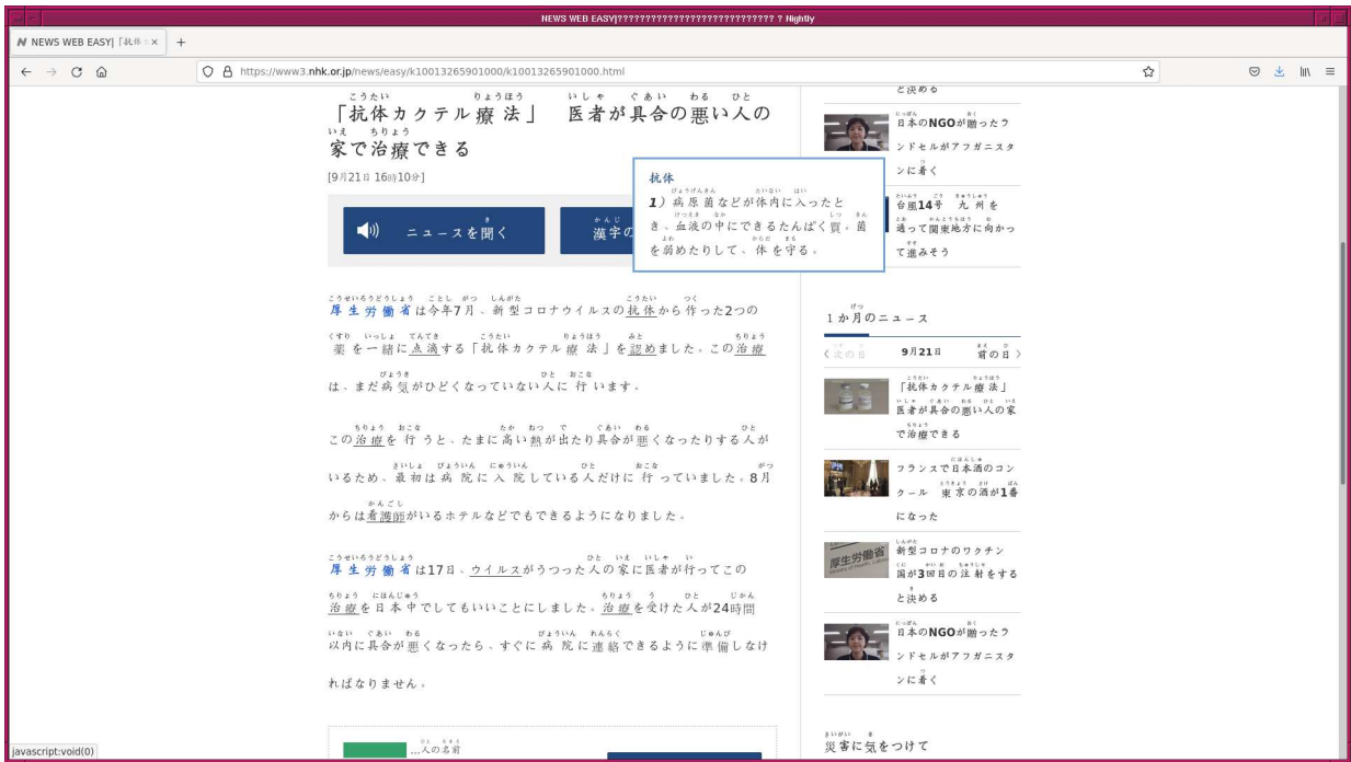
Figure 6: NHK の “News Web Easy” では、難しい専門用語についての説明が表示される。