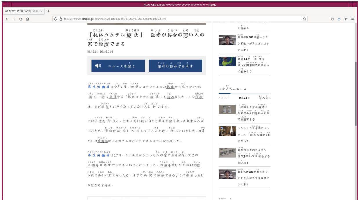
Figure 3: NHK の “News Web Easy” の個別の記事のページで、漢字の振り仮名を表示させている状態。