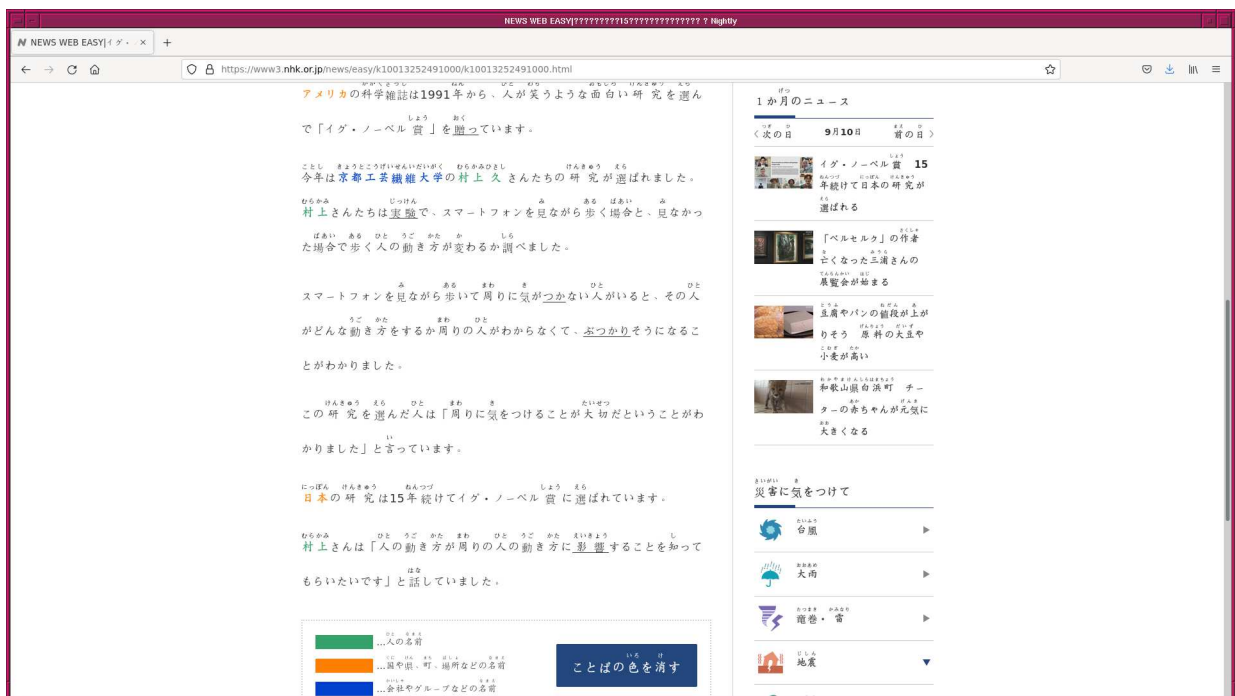
Figure 5: NHK の “News Web Easy” では、人名、地名、団体名、組織名などの固有名詞は色を変えて表示している。