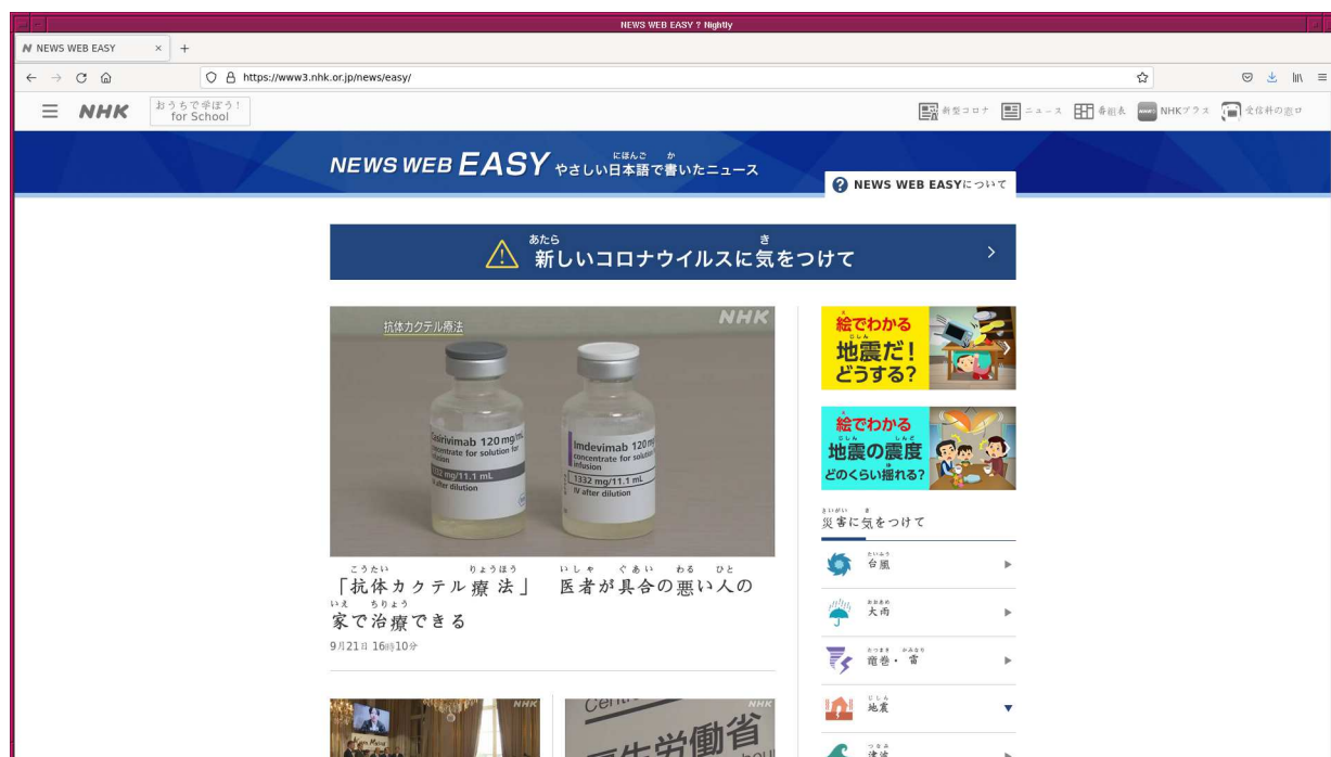
Figure 1: NHK の “News Web Easy” のページ。

更に、「普通のニュースを読む」というボタンを押すと、通常のニュースのページが表示されます(図 7 および図 8)。“News Web Easy”の記事が簡単だった場合には、通常のニュースも読んでみるとよいでしょう。