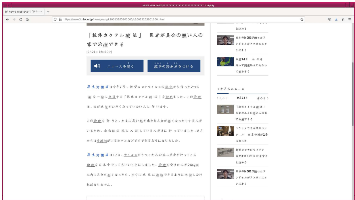
Figure 4: NHK の “News Web Easy” の個別の記事のページで、漢字の振り仮名を隠した状態。