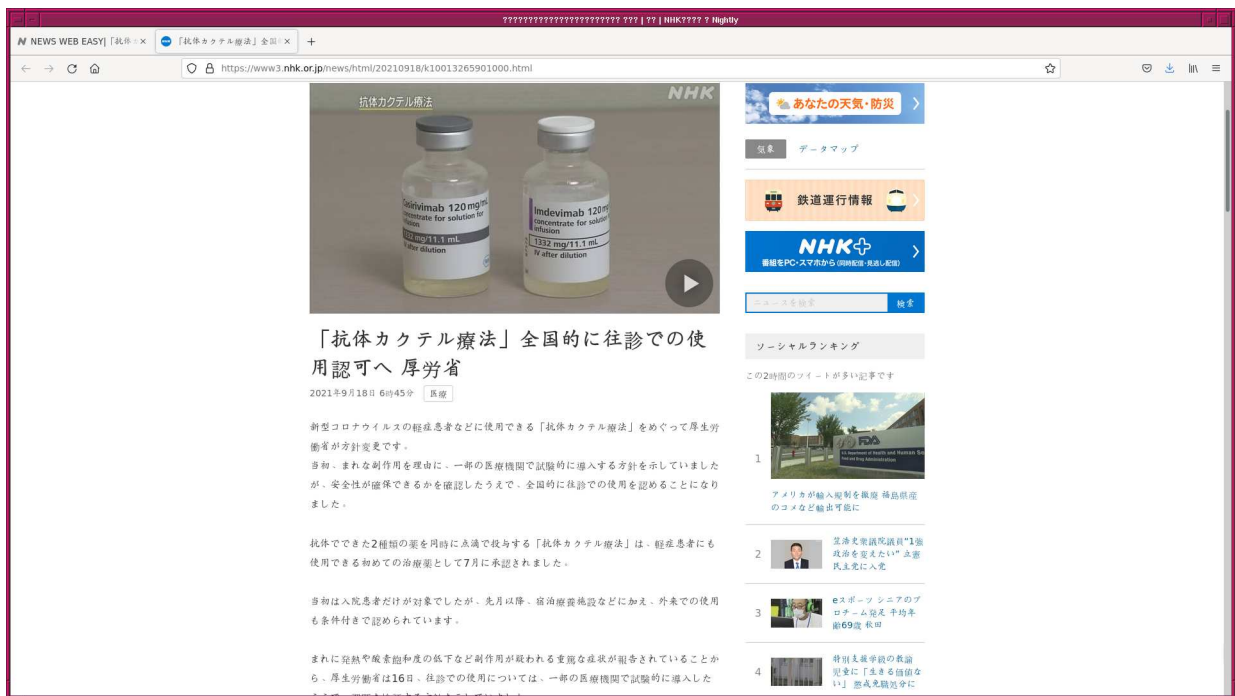
Figure 8: 「普通のニュースを読む」というボタンを押すと、通常のニュースのページが表示される。